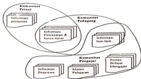
Gambar 2. Contoh Informasi yang ditawarkan pada beberapa komunitas oleh perangkat lunak Pelayanan ICT

Untuk mendukung program ICT ini perlu dibuat sebuah perangkat lunak yang bisa menampilkan berbagai informasi yang dibutuhkan. Perangkat lunak ini bisa bertindak sebagai recommender system atau sistem yang bisa menawarkan informasi apa saja yang layak untuk diketahui oleh sebuah komunitas secara otomatis. Masing – masing komunitas akan diberikan informasi sesuai dengan domain masing – masing . informasi yang ditampilkan pada masing – masing komunitas bisa berbeda sama sekali atau terdapat overlapping secara sesuai. Sebagai contoh bisa dilihat pada Gambar 2.