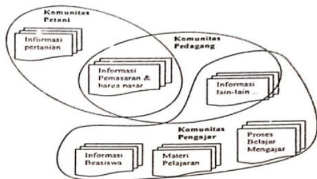
Gambar 2. Contoh Informasi yang ditawarkan pada beberapa komunitas oleh perangkat lunak Pelayanan ICT

Untuk mendukung program ICT ini perlu dibuat sebuah perangkat lunak yang bisa menampilkan berbagai informasi yang dibutuhkan. Perangkat lunak ini bisa bertindak sebagai recommender system atau sistem yang bisa menawarkan informasi apa saja yang layak untuk diketahui oleh sebuah komunitas secara otomatis. Masing – masing komunitas akan diberikan informasi sesuai dengan domain masing – masing . informasi yang ditampilkan pada masing – masing komunitas bisa berbeda sama sekali atau terdapat overlapping secara sesuai. Sebagai contoh bisa dilihat pada Gambar 2.