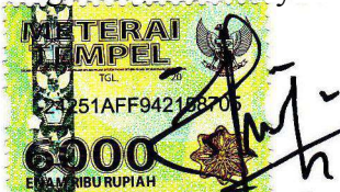
Sugih Nugroho A 11160005