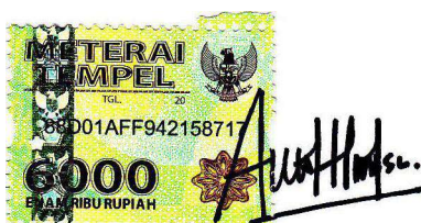
Ayu Hirda Darmafaga Alamsyah 11160033